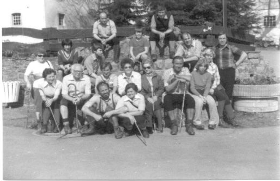
Am 15.04.79 auf einer Wanderung Arnsberg – „Hubertuspöstchen – Hellefeld