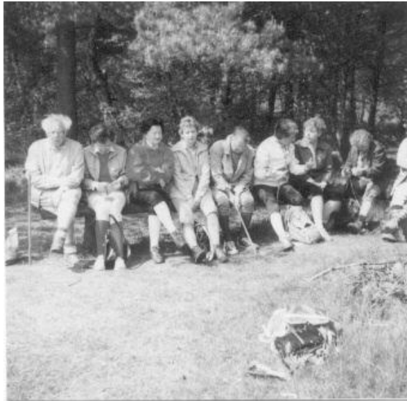
Rast in der Lüneburgerheide