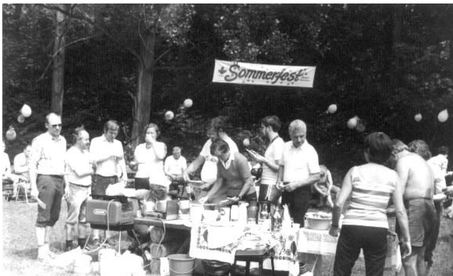
Sommerfest auf dem Wanderparkplatz „Himmelpforten“ an der Möhne

Leider nahmen hieran nur 48 Mitglieder teil. Diese Zahl konnte man ebenso am 20. Juli 1986 zählen. Damals fand das Sommerfest letztmalig auf dem grossen Wanderparkplatz „Himmelpforten“ bei Niederense statt.