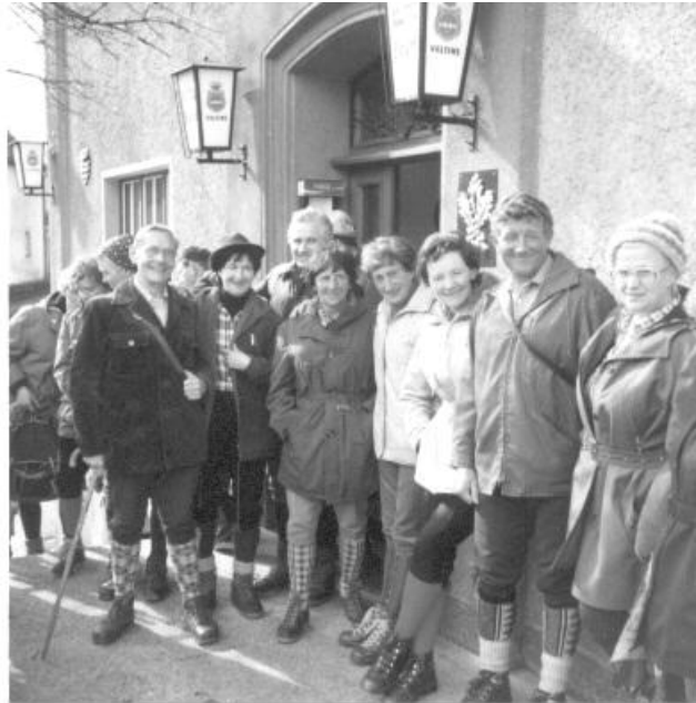
Weuspert – Anbringen des SGV-Schildes am 15.03.81

Ein anderer Wanderfreund, der stets darauf bedacht war, ein sauberes Auto zu haben, wechselte nach der Wanderung für die Rückfahrt seine Schuhe. Ob er seine verschmutzten Wanderschuhe nicht in den Kofferraum stellen wollte, weiß man nicht. Er nahm sie nicht mit, sie blieben im Sauerland und ob der Wanderfreund noch am Abend ins Sauerland gefahren ist, ist nicht bekannt..