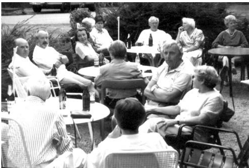
Radwanderfreizeit am Niederrhein in Wasserburg-Rindern vom 28. - 30.07.89

Wie in den Vorjahren nahmen auch in diesem Jahr mehrere Mitglieder der Abteilung an der jährlichen Aktion „Saubermann“ des Stadtbezirks Heessen teil. In der Zeit vom 28. bis 30. Juli fand eine Radwanderfreizeit statt, an der sich 44 Mitglieder beteiligten. Als Standquartier war die Wasserburg Rindern bei Kleve ausgewählt worden.