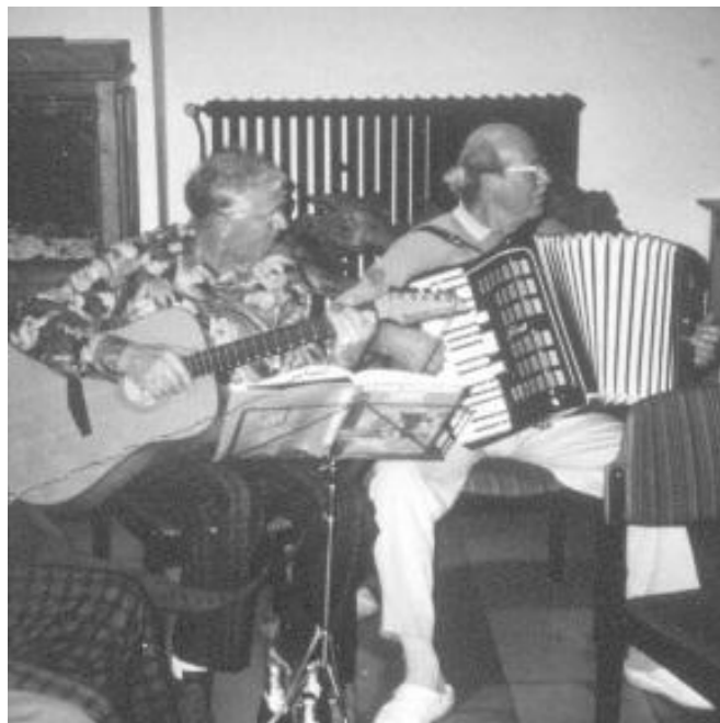
Unsere Tanzkapelle in Cloppenburg

Das Herbstfest der Abteilung, bisher jährlich als Tanzabend begangen, sollte auf Wunsch der Mitglieder anders gestaltet werden. Die Beteiligung war stark zurückgegangen. Die Kosten für Musik und GEMA-Gebühren waren mit 400 DM zu hoch.